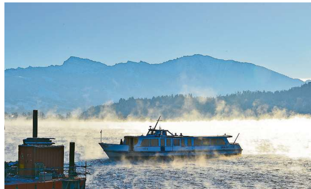
Mystische Stimmung: An diesem kalten Morgen schweben Nebelschwaden rund um das Schiff.

Wie genau ein über 40 Tonnen schweres Schiff sicher aus dem Wasser gehoben