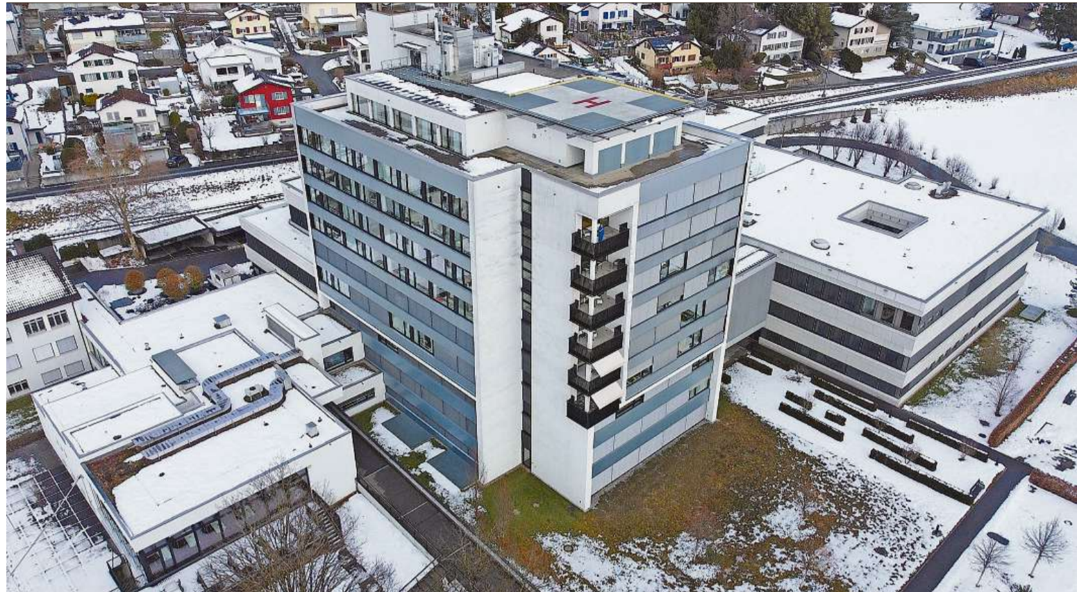
Zukunft geregelt: Nach belastender Unsicherheit kann die Belegschaft des Spitals Linth aufatmen.