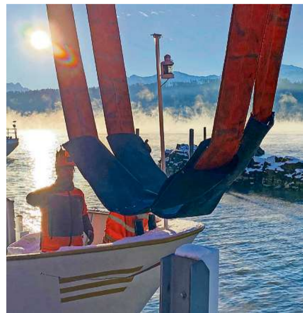
Zwei Schlaufen und eine Krönungskrone: Mit einem Kran wird das Schiff aus dem Wasser gehoben.